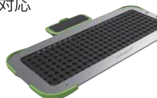
長方形アレイオプション