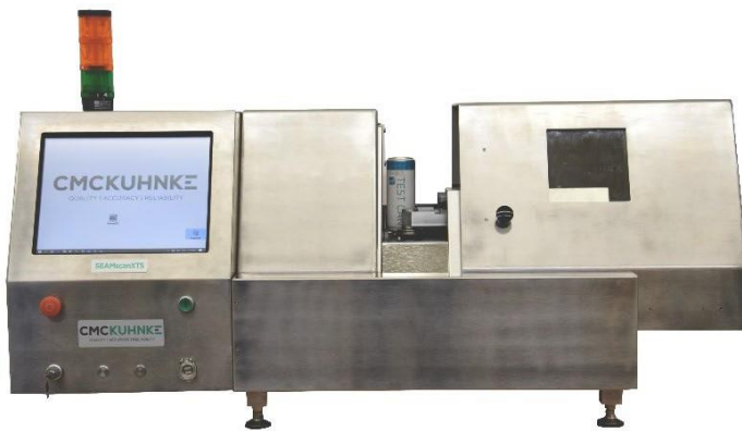
SEAMSCAN XTS III

測定項目： ダブルシーム検査（シーム高さ、Body Hook、Cover Hook、Overlap、シームギャップ、% Body Hookバッティング）及びリンクル（しわ）の評価（%タイトネス）