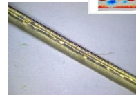
新しいリンクル可視化機能